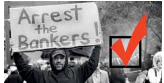
Kuva: Pidättäkää pankkiirit. / www.alternet.org