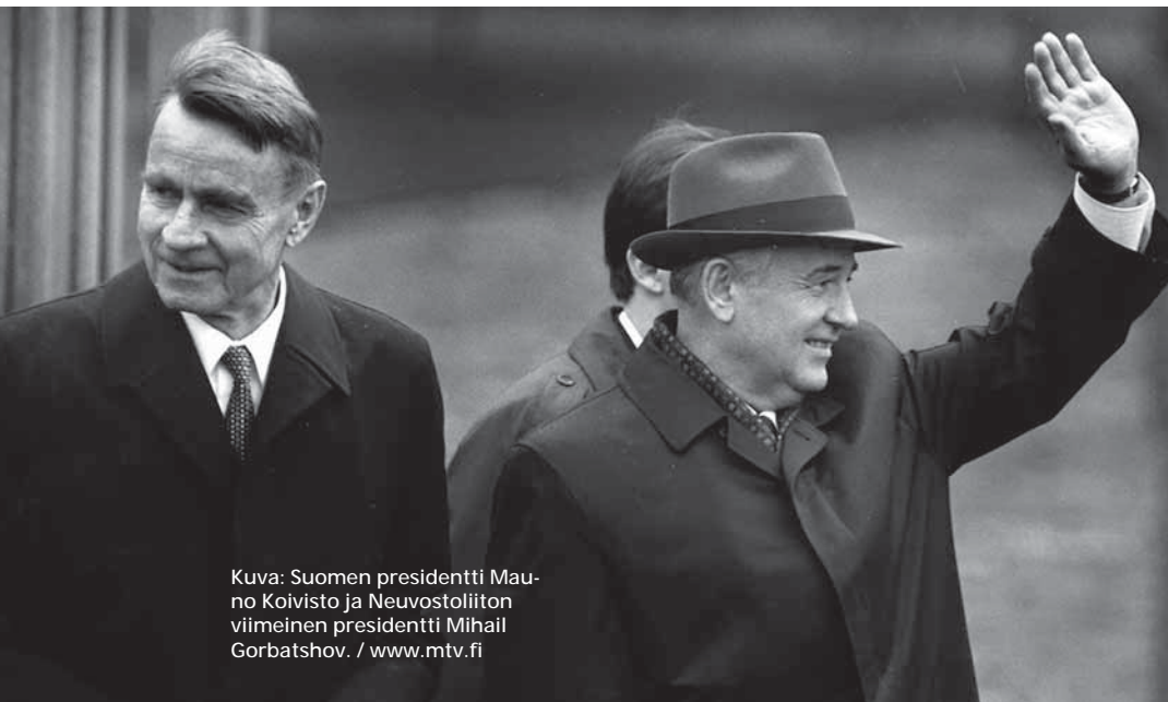
Kuva: Suomen presidentti Mauno Koivisto ja Neuvostoliiton viimeinen presidentti Mihail Gorbatshev.

valmistelu alkoi säästölain hyväksymisellä eduskunnassa 17.01.1992 ilman, että eduskunta tiesi, mitä lailla tehdään - tuhoataan Hallitusmuodon 2 §.