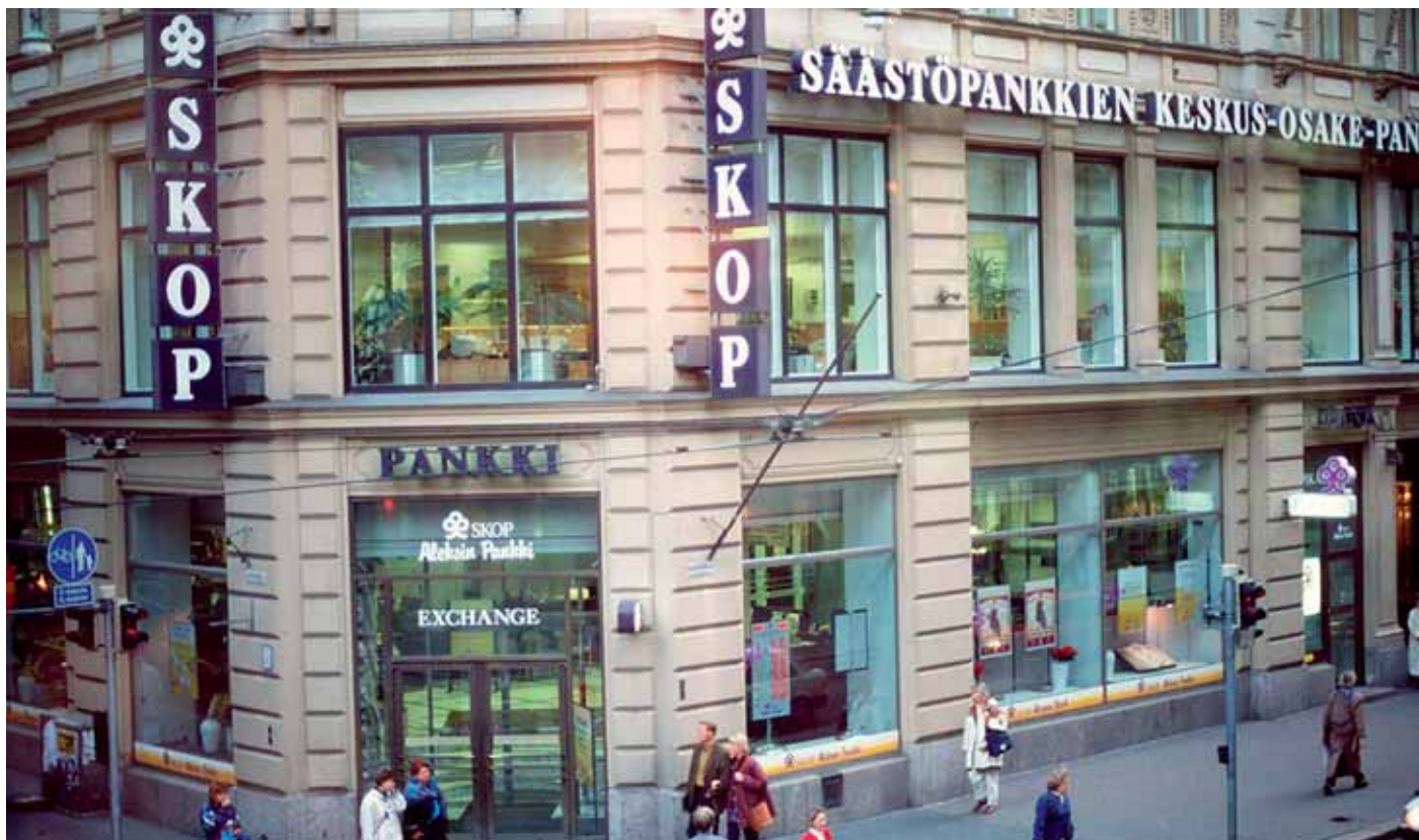
Kuva: SKOP:sta tehtiin yksi pääsyyllinen, vaikka kaikki liikepankit olivat konkurssikypsiä.