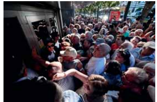
Kuva: Kreikan pankkikriisi.