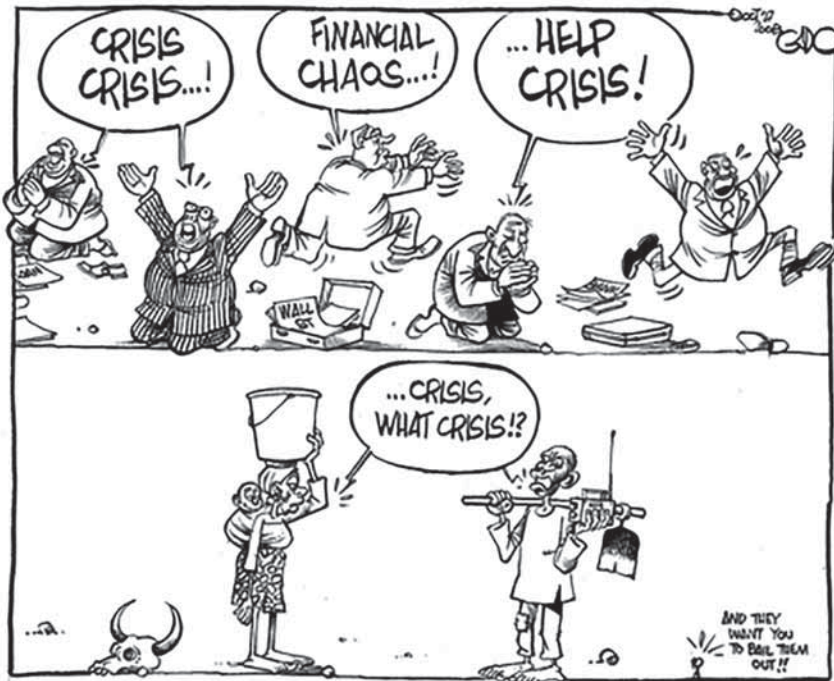
Kuva: Taloudellisesti kehittyvässä maassa, jotka tarkoittaa aikehittynyttä maata, voidaan hyvin kysyä, kriisi, mikä kriisi?

ja erityisesti suomalaisten perusoikeuksiin. Nimittäin Eta-säännökset – liiki kaikenlaiset, mm. pöytäkirjan liitteet – saavat tässä lakipaketissa olevan voimaannanolain perusteella hyvin korostetun aseman. Jokainen suomalainen, joka soveltaa suomalaista lakia, siis viranomainen, joka tehtävästä riippumatta soveltaa suomalaista lakia, on nimittäin velvollinen olemaan soveltamatta sitä, jos se on ristiriidassa jonkun asteisen Eta-sopimukseen sisältyvän säännöksen kanssa, mm. pöytäkirjan liitteiden kanssa.”