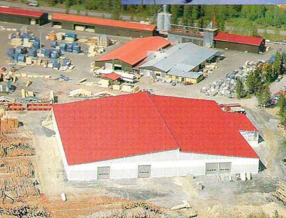
Kuva: Menestyneistä yrittäjistä tulikin syrjittyjä työttömiä.