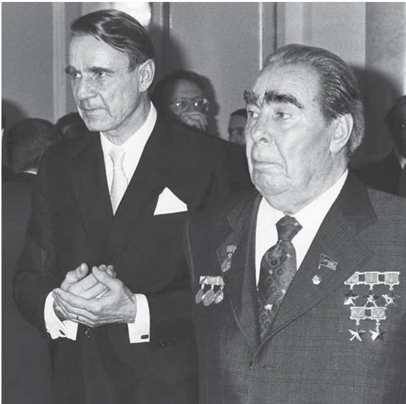
Kuva: Presidentti Mauno Koivisto ja Neuvostoliiton presidentti Leonid Brezhnev. Iltalehdessä oli juttu, jonka mukaan Koivisto oli KGB:n narussa.